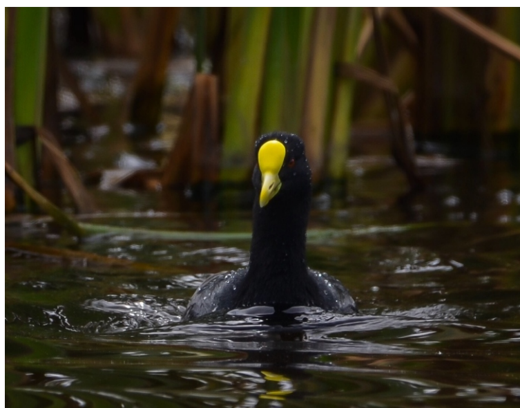
Figura 1. Fulica leucoptera fotografiado en Pantanos de Villa el 19 de agosto de 2019.

El 31 de julio de 2019, a las 8 h y 30 min el personal