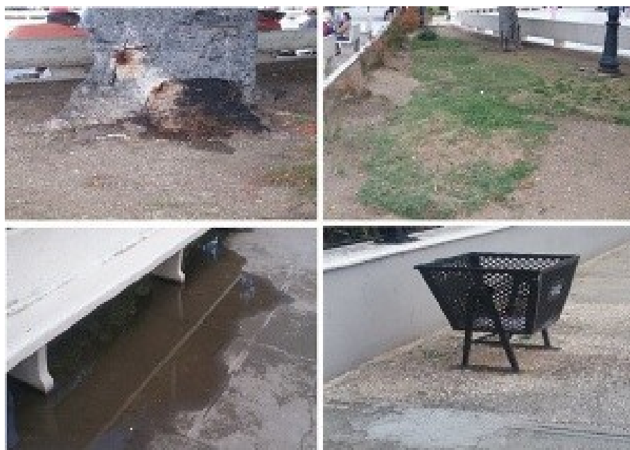
Figura 2. Zonas del parque “Calixto García” donde se hace evidente la indisciplina social, y la falta de gestión ambiental.

El parque “San José”, se encuentra en buen estado de conservación, pero se necesita de una mejor gestión ambiental por la ausencia de depósitos para verter la basura, aunque los pobladores por lo general no lanzan desechos al piso porque es un parque con una referencia eclesiástica, a lo que les impulsa a mantener limpio el mismo. Es preciso destacar que las áreas verdes en este parque se encuentran mal tratadas y sin cuidado, lo que indica que hace falta de personal indicado y preparado en mantener la limpieza y ordenamiento.