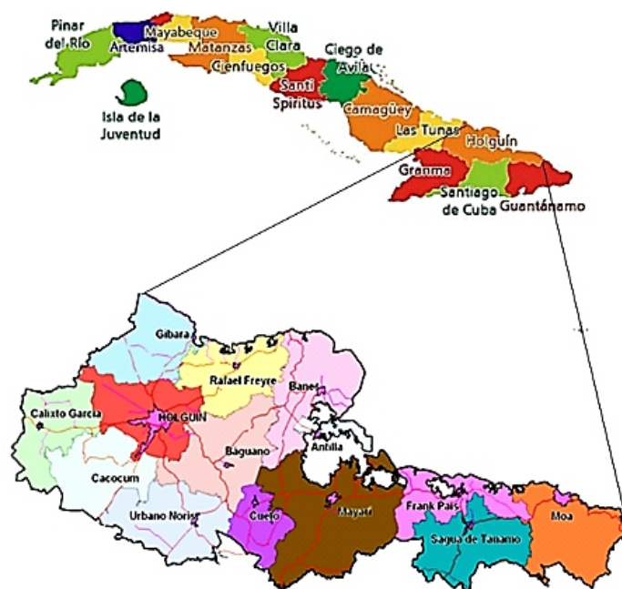
Figura 1. Mapa político administrativo de Cuba y la provincia de Holguín con sus 14 municipios.

Holguín es un territorio compacto formado por 14 municipios (Fig. 1), que son: Holguín, Antilla, Báguamo, Banes, Cacocum, Calixto García, Cueto, Frank País, Gibara, Mayarí, Moa, Rafael Freyre, Sagua de Tánamo y Urbano Noris (NANC, 1989).