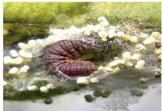
Figura 4. Larva de E. zinckenella preparando la cámara para pupar dentro de la guaba de C. cajanus .

El descubrimiento de una especie de avispa parasitoide Bracon sp. atacando a las larvas de E. zinckenella en plantaciones de guandú en Altos de Pacora, Cerro Azul, Panamá, representa un hallazgo significativo en el campo del control biológico. Hasta ahora, se ha documentado que varias especies de la familia Braconidae parasitan a E. zinckenella ; entre estas, destacan: Bracon hebetor (Say, 1836), Apanteles hemara (Nixon, 1973), Bracon brevicornis (Wesmael, 1838), Habrobracon hebetor (Say, 1836), Chelonus sp., Microplitis demolitor (Wilkinson, 1931), Cotesia ruficrus (Haliday, 1834), Meteorus pulchricornis (Wesmael, 1835); estas especies han sido estudiadas y reportadas en diversas regiones del mundo, destacándose por su eficacia en el control biológico de E. zinckenella (Quicke, 2015; Shaw & Huddleston, 1991; Wharton et al. , 1997). Sin embargo, la especie de avispa parasitoide Bracon sp., observada en este estudio no coincide con las previamente documentadas.