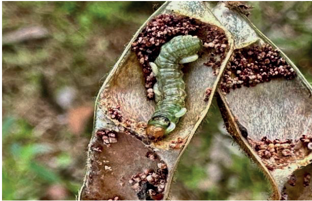
Figura 2. Larva de E. zinckenella parasitada, con cinco larvas de la avispa parasitoide Bracon sp. encima de su cuerpo.

Las larvas parasitadas fueron recolectadas y llevadas al laboratorio del Museo de Invertebrados para un análisis más detallado. En el laboratorio, las larvas parasitadas fueron mantenidas en condiciones controladas para monitorear el desarrollo de los parasitoides.