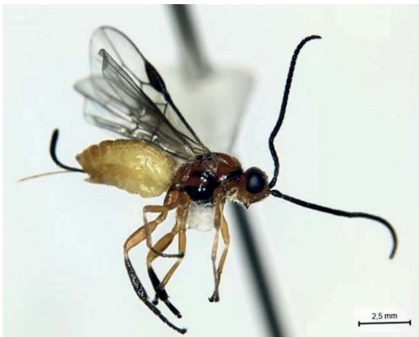
Figura 3. Hembra de Bracon sp. (Hymenoptera: Braconidae).

Después de un período de dieciséis días se registró la eclosión de un total de 10 adultos de la avispa parasitoide Bracon sp. (Fig. 3). Este resultado confirma que las larvas de E. zinckenella sirven como huéspedes adecuados para el desarrollo completo de estas avispas, desde la oviposición hasta la eclosión de los adultos.