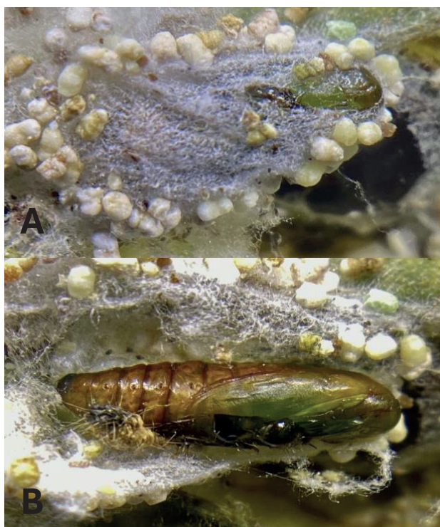
Figura 5. A. Pupa de E. zinckenella dentro de la cámara, envuelta en hilo de seda para pupar dentro de la guaba de C. cajanus . B. Pupa de E. zinckenella , expuesta.

En conclusión, la identificación de la especie de avispa parasitoide Bracon sp. que ataca a E. zinckenella en Panamá es un avance significativo en el estudio del control biológico de plagas. Este descubrimiento no solo amplía el conocimiento sobre la biodiversidad de las avispas Braconidae en el país, sino que también proporciona una nueva herramienta potencial para la gestión de plagas en cultivos de guandú.