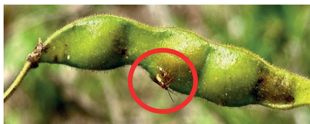
Figura 1. Hembra de Bracon sp., parasitando larvas de E. zinckenella , en guaba de Cajanus cajanus .

Este enfoque no solo es ecológicamente sostenible, sino que también ofrece una alternativa a los pesticidas químicos, reduciendo el impacto ambiental y promoviendo una agricultura más sostenible (Chen & Wang, 2019). El 12 de mayo de 2024, se observó por primera vez la interacción entre la avispa parasitoide Bracon sp. (Hymenoptera: Braconidae) (Fig. 1) y las larvas de Etiella zinckenella (Lepidoptera: Pyralidae) (Fig. 2) en plantaciones de guandú en Altos de Pacora, Cerro Azul, Panamá.