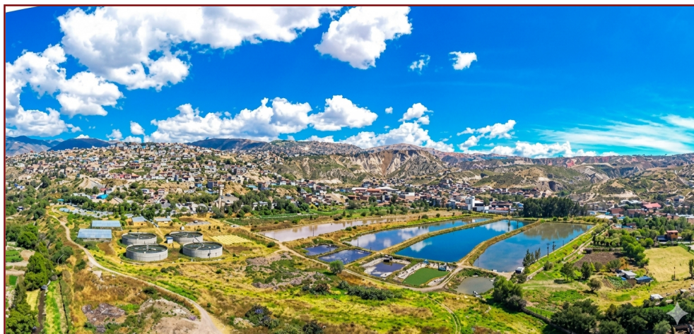
Figura 2 Planta de tratamiento de aguas residuales La Totora

Nota. SEDA AYACUCHO S.A.