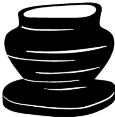
Figura 6 Animación de una vasija de arcilla

cuando aplicamos el sentido al texto, entonces le estamos dando vigencia histórica, estamos tomando la experiencia y el sentido oculto que subyace en ella para procesarla, develar lo que ella encierra y mostrarla, entregando a la academia un acercamiento al que y porqué los eventos ocurren de una forma u otra.