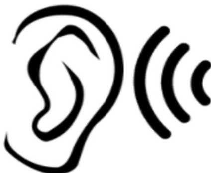
Figura 5 Esquema relacionado con el oír el texto