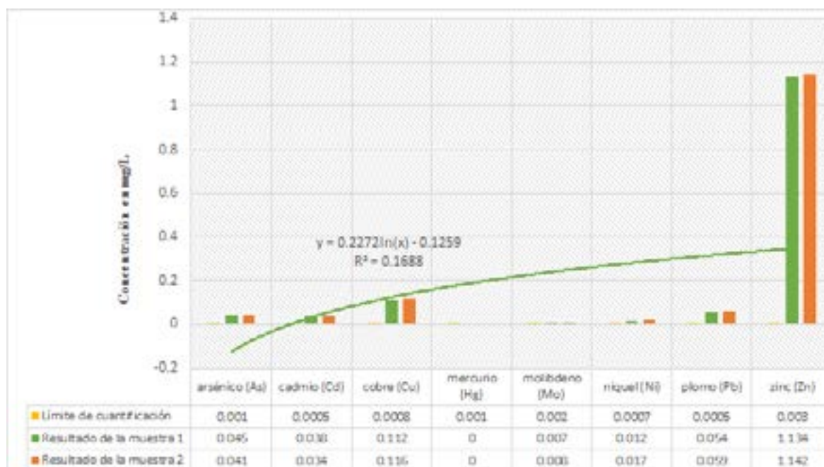
Figura 3. Relación de resultados de muestra 1 y 2 con el límite de cuantificación del método.

En la figura 3, se muestra la relación de los resultados de metales pesados en la muestra 1 y 2 con el límite de cuantificación del método utilizado para el análisis.