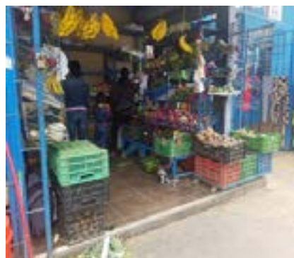
Figura 1. Toma de muestra de papa negra Solanum Tuberosum